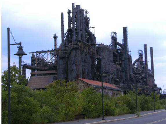
Bethlehem i takový