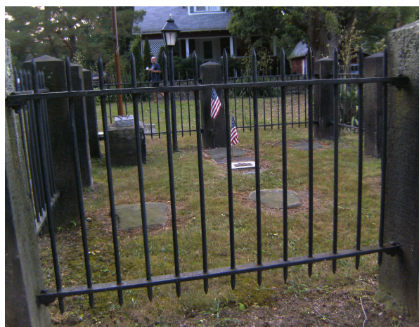
Hrob Davida Zeisbergera v Goshen