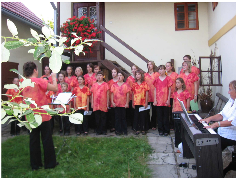
Dětský pěvecký soubor Skřivánek - Suchdol n.O.

Do přípravy expozice se zapojilo téměř 50 našich členů a příznivců, což je uspokojivé konstatování. Příprava probíhala od konce loňského roku, odsouhlasena byla výroční schůzí 3. 3. 2008 i s rozpočtem. Na počátku roku probíhalo podrobné studium velice obsáhlého životopisu Davida Zeisbergera z různých překladů, které byly provedeny v minulých letech a letos se jen odhalovaly bílá místa jeho života. Vznikal scénář znovu a znovu vybrušovaný, takže finální verze měla číslo 22. Současně vznikala publikace David Zeisberger. Od časného jara jsme intenzivně pracovali na zajišťování financí. V červenci jsme obdrželi zprávu, že nám byla odsouhlasena žádost o grant Zamlčené dějiny – Moravští bratři v hodnotě 110 000 Kč, na něž nám přispěl polovinou 55 000 Kč Česko-německý fond budoucnosti, 45 000 Kč městy Suchdol, 10 000 Kč náš vlastní vklad. Během prázdnin se korespondovalo s místy kde David Zeisberger žil, tedy Herrnhut, Pensylvánie, Ohio, Kanada, prováděly se korektury textů, překládaly do němčiny a angličtiny, obrazový materiál byl získáván ze zaslaných publikací a